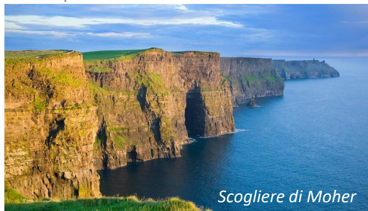
Scogliere di Moher

Prima colazione in hotel. Partenza per la regione del Burren, una formazione geologica molto particolare, i cui paesaggi lunari e desertici nascondono innumerevoli tesori archeologici, botanici e zoologici. Sosta per la vista del Castello di Bunratty . Proseguiremo per la visita alle Cliffs of Moher dove si potrà provare l'emozione di camminare sulle scogliere più famose d'Irlanda. Nel pomeriggio partenza verso Galway. Arrivo in hotel, cena e pernottamento.