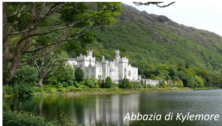
Abbazia di Kylemore

Prima colazione in hotel. Partenza alla volta del Connemara, regione di incredibile e selvaggia bellezza. Pranzo libero. Partenza per Kylemore per visitare il suo monastero Benedettino , situato in uno dei più pittoreschi paesaggi della regione. Rientro a Galway, cena e pernottamento in hotel