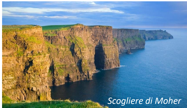
Scogliere di Moher

Prima colazione in hotel. Partenza per la cittadina di Galway dove il gruppo farà un tour guidato a piedi per le vie della città giovane e dinamica, piena di storia da raccontare. Partenza per la regione del Burren, una formazione geologica molto particolare, i cui paesaggi lunari e desertici nascondono innumerevoli tesori archeologici, botanici e zoologici. Visita alle Cliffs of Moher dove si potrà provare l'emozione di camminare sulle scogliere più famose d'Irlanda. Arrivo in hotel a Galway, cena e pernottamento.